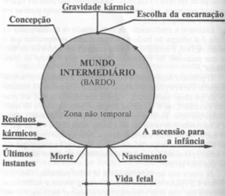
A RODA DA EXISTÊNCIA

suprema só pode ser alcançada por aqueles cujo karma inteiro está saldado. Estes entram na clara luz da felicidade e em lugar de novamente descer aos planos de consciência como os outros, são completamente absorvidos por ela. É o que também chamamos de "o grande caminho vertical". Ele simboliza o fim da necessidade de renascer, a transcendência total da roda da existência.